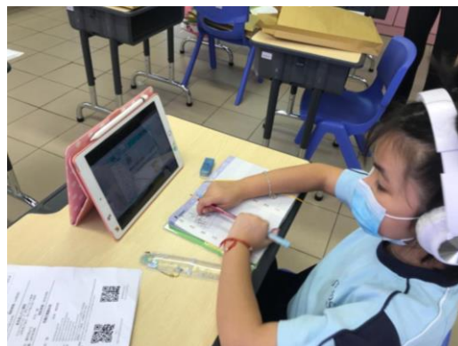
同學一邊上課，一邊認真做筆記。