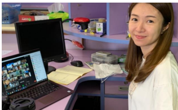
中文科老師利用 ZOOM 進行實時視像課堂。

因應新型冠狀病毒肺炎第三波疫情再度在本港爆發，教育局宣佈九月起暫停所有面授課程，轉用網上授課。本校中文科老師務求學習進度不會落後，便重新修訂了學習課程，除了繼續利用 ZOOM 進行實時視像課堂，也運用了 VLE 平台上載課業及批改學生功課，讓學生可以收到教師的批改及回饋，讓學習得以持續。