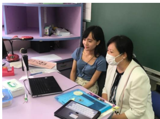
梁校長也參與中文 ZOOM，並跟學生打氣。