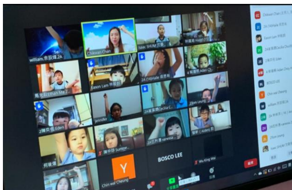
同學在家裏專心上課。