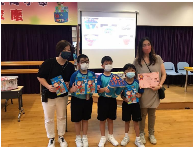
冠軍：2A 「SYPS 太空橈」