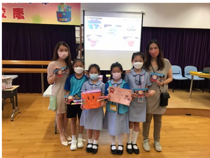
優異獎：2E 「小貓樂園橈」