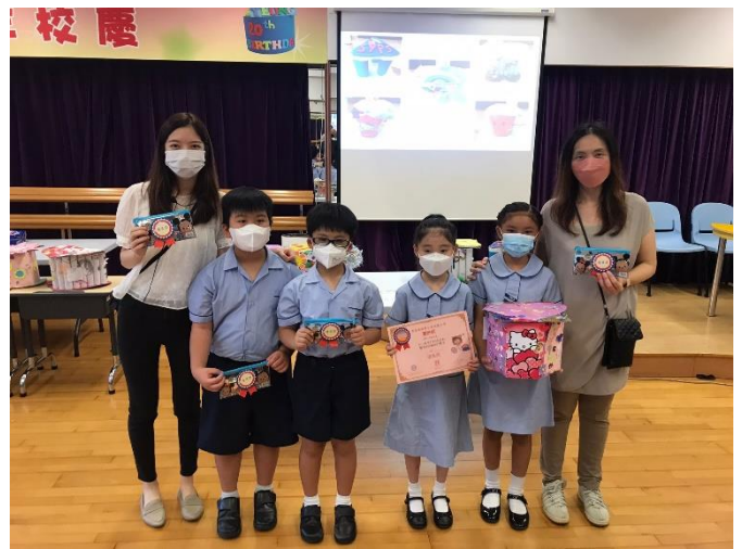
優異獎：2C 「夢想世界橈」