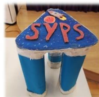
2A 「SYPS 太空橈」