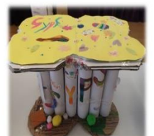
2B 「SYPS 多功能橈」