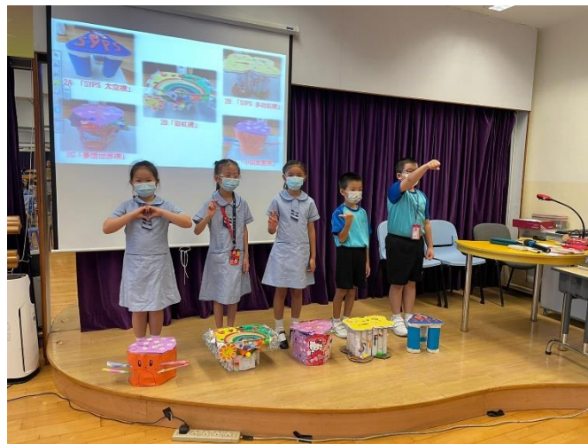
各班簡介作品及拉票