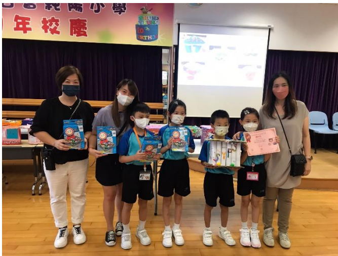
季軍：2B 「SYPS 多功能橈」