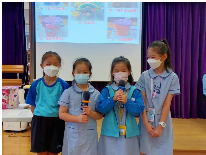
各班簡介作品及拉票