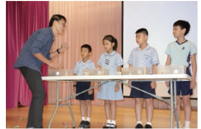
學生參與礦工體驗活動