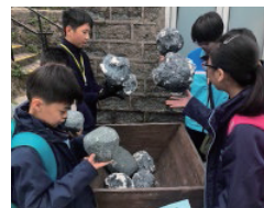
學生認識昔日礦工的艱苦工作