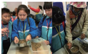
學生認識昔日開採鐵礦的方式