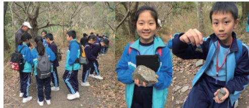
學生在昔日的鐵礦場附近尋找磁鐵礦