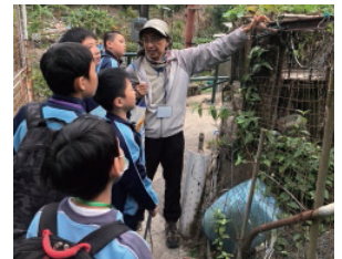
學生透過走訪礦村，了解昔日礦村的面貌和礦工的生活環境