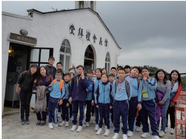
學生參觀鞍山探索館大合照