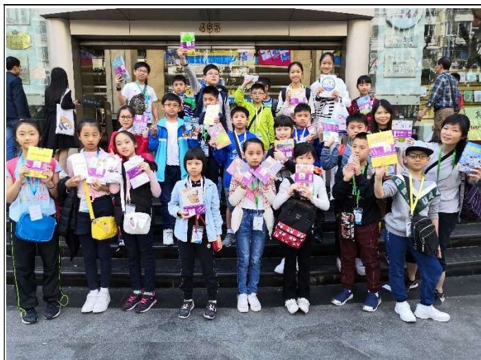
我們在書城「大出血」啊!