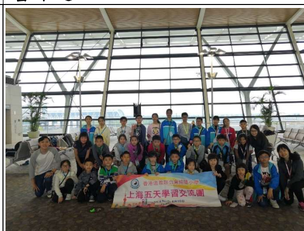
上海五天學習交流團圓滿結束！