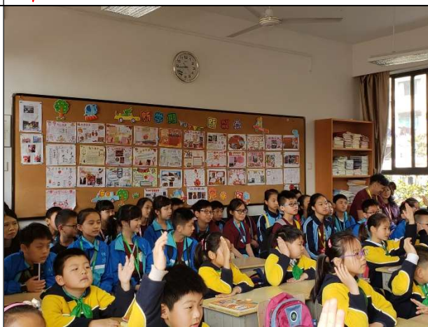
上海的學生都專心致志，認真學習。