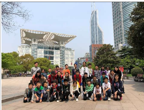
上海先進的建築—上海城市規劃館。