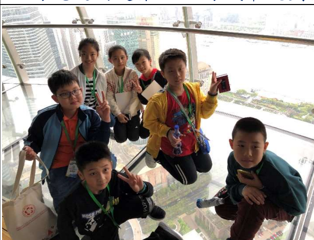
在 263 米高的東方明珠塔向下望，真的驚心動魄!