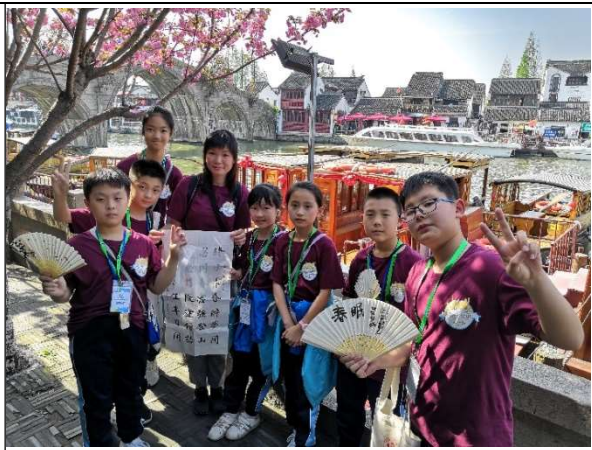
朱家角內桃花處處，景色怡人!