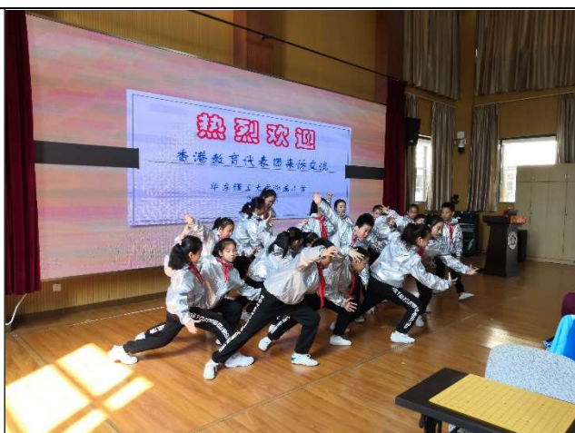
華東理工附屬小學同學表演勁歌熱舞