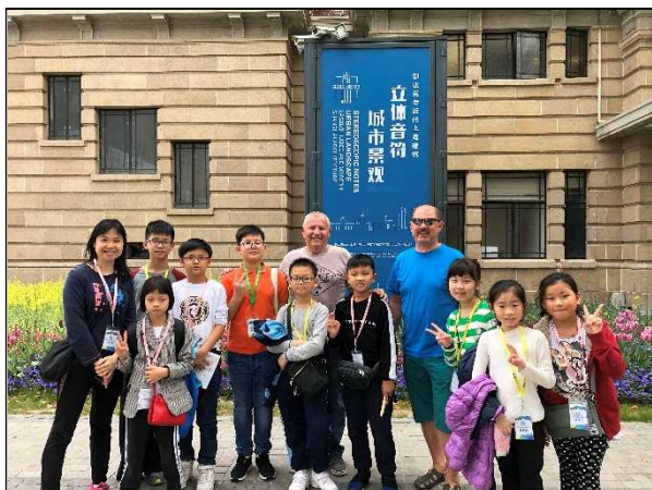
上海歷史博物館外巧遇波蘭遊客!