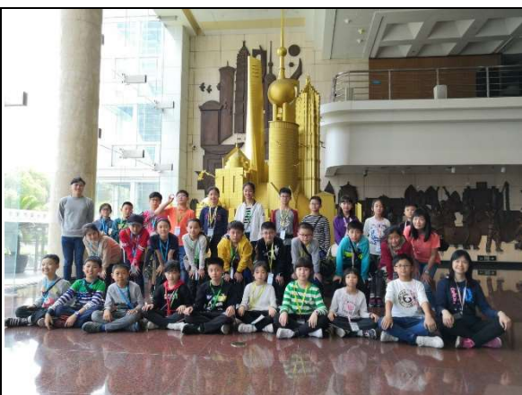
身後是上海今天繁榮的標誌!