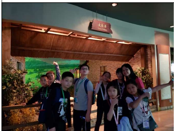
大家在了解上海的「克薩羊」!