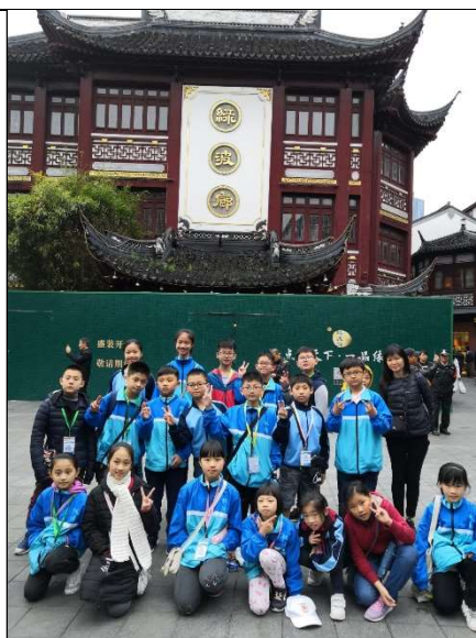
城隍廟內的亭台樓閣，別具一番懷舊味道！