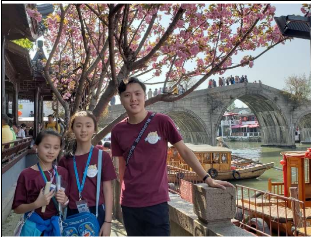
朱家角內的小橋流水，景致迷人!