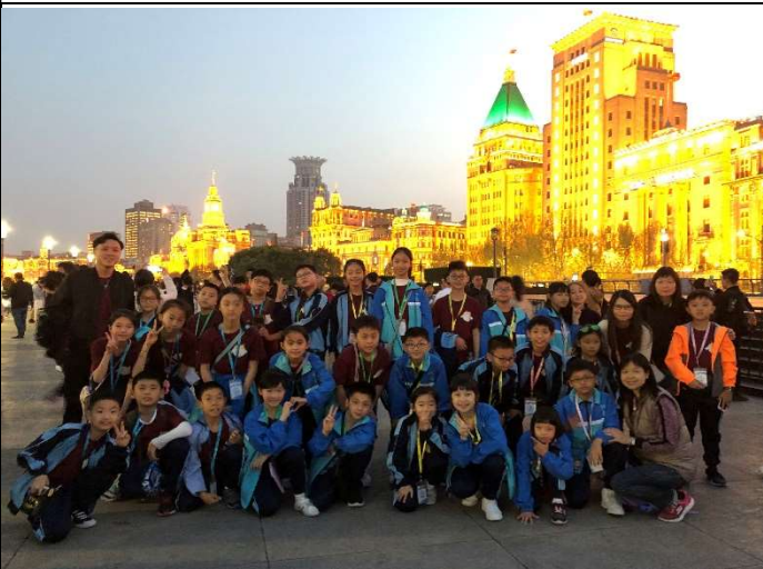
金光閃耀的上海黃埔外灘