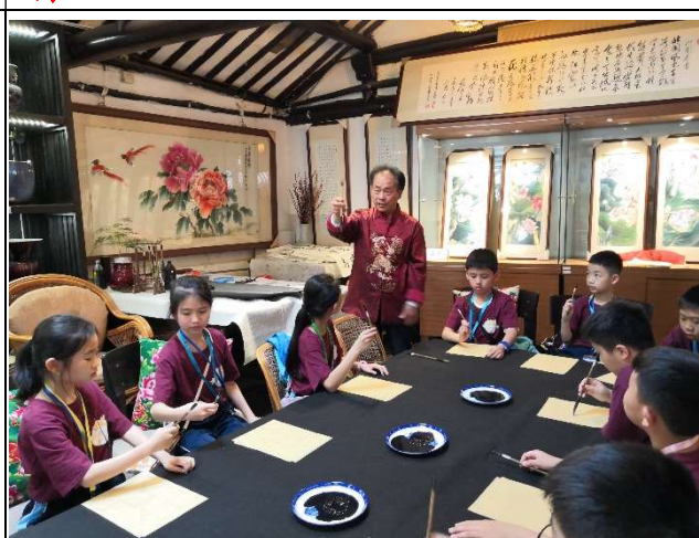
書法老師在指導學生正確的執筆！