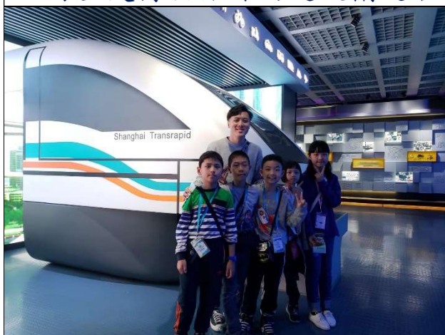
真希望可乘坐上海的磁浮列車!