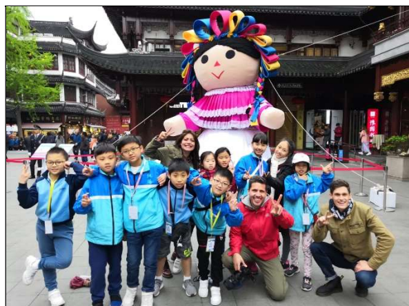
巧遇莫斯科電視台攝製隊，我們都上鏡了！