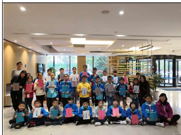
多謝老師們送給我們的紀念品！