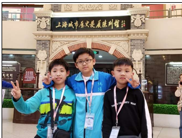
上海城市歷史陳列館記載了舊上海市民生活的狀況！