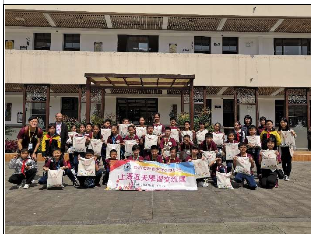
多謝華東理工大學附屬小學給我們每人一份禮物！