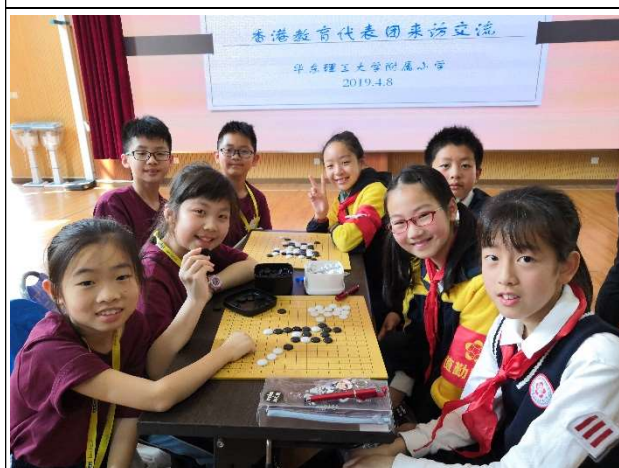
我們在虛心學習下「五指棋」！