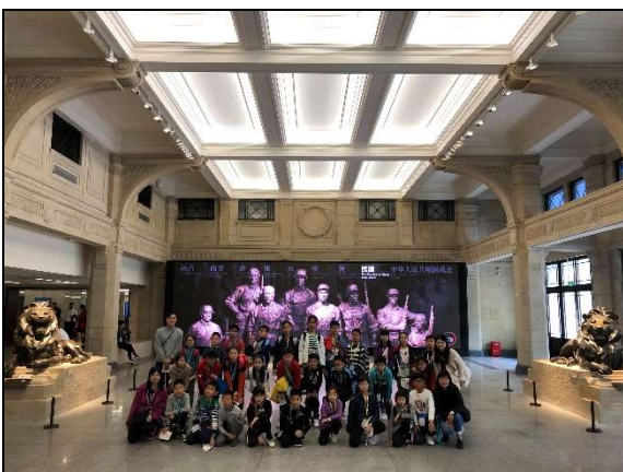
身後的獅子正是上海滙豐銀行的「真身」!