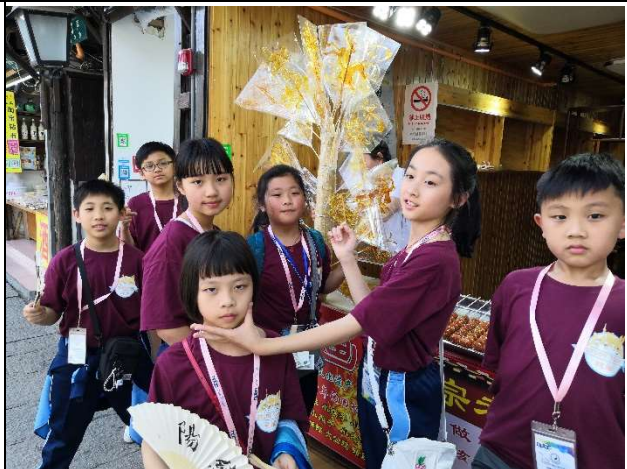
同學在光顧當地的小食-糖餅!