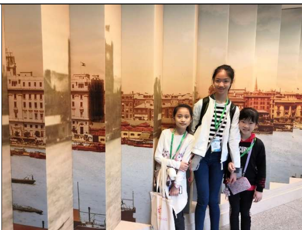
我們在舊上海照片前留情影。