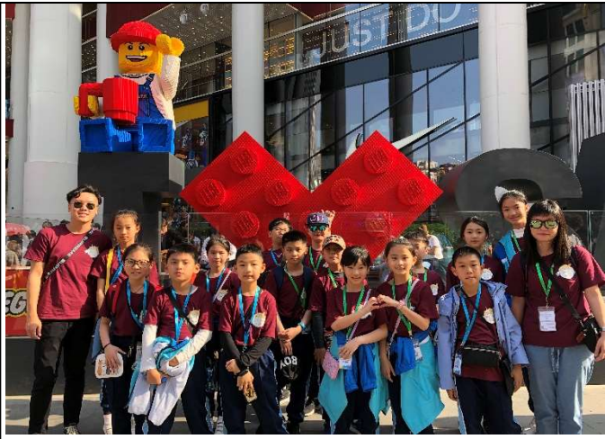
在樂高店外已被吸引了!