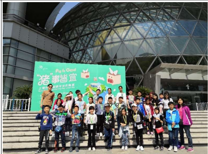
上海科技館前留照!