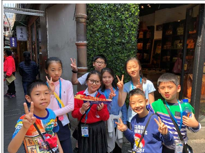
學生被田子坊內的美食吸引了!