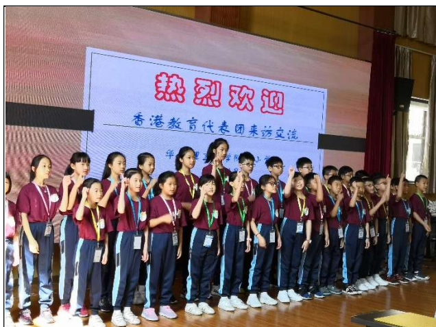
我們正用手語演唱《明日恩典》