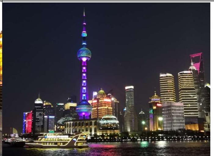
迷人的上海夜—遠望東方明珠塔