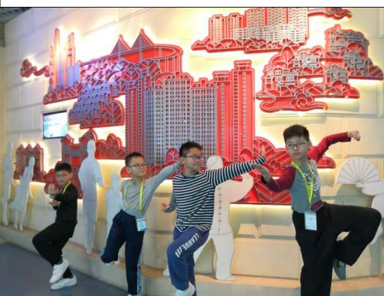
看!我們在表演真功夫!