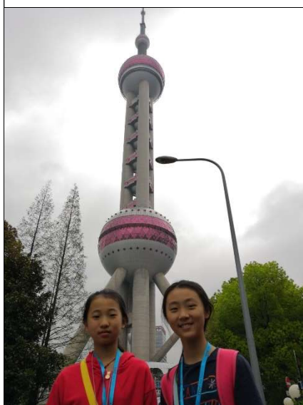
身後的明珠塔建築得多美!