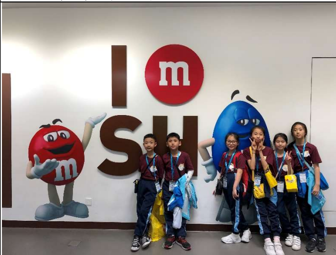
大家對不同種類的朱古力感好奇!