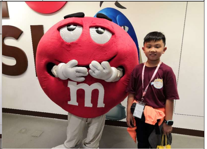
我與朱古力豆，超可愛!