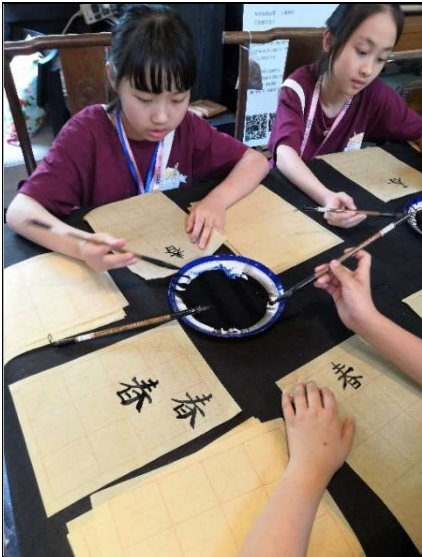
看!學生們多專心地練習書法!