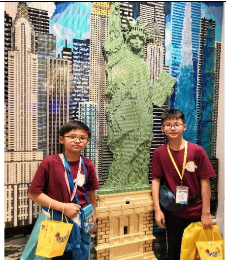
偉大的自由女神啊!YEAH!