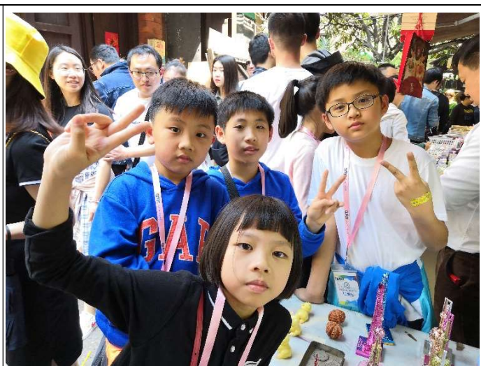
田子坊內有不同特色的商店!