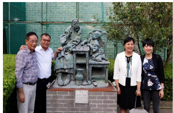
大家在茶山南社古村落遊覽，觀賞雕塑藝術