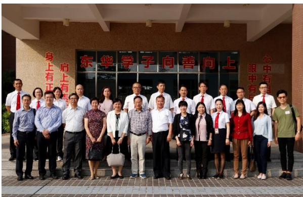
全體同仁在生態園校區合照留念

此次全面的交流為兩校今後開展姊妹學校活動打下堅實的基礎，相信純陽小學和東華小學兩所姊妹學校定能攜手共進，邁步前行。