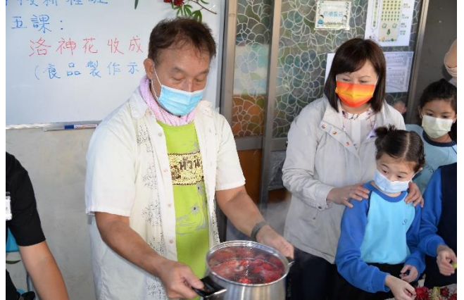
4 導師示範花茶的制作