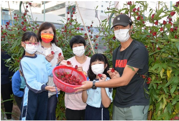
3 校長與各個家庭一起採摘洛神花