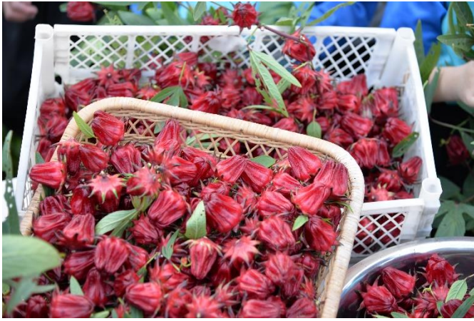
7 顏色鮮艷的洛神花