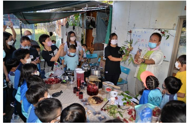
2 導師介紹洛神花食品的益處