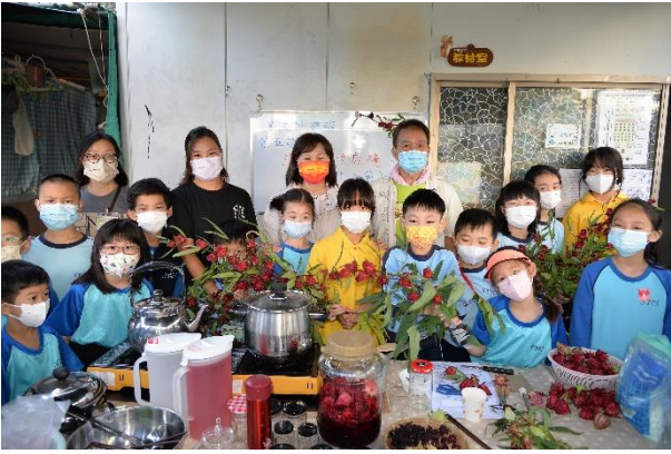
1 2122 年前的洛神花收成禮開始了