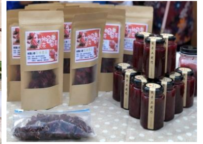
8 林林總總的洛神花食品：啫喱、果醬、花茶