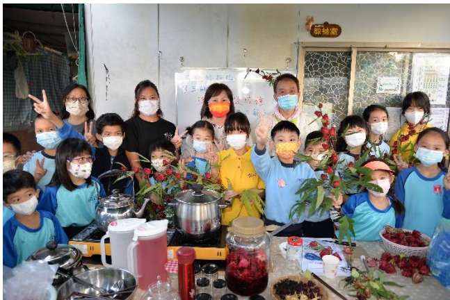
5 梁校長親自製作洛神花果醬