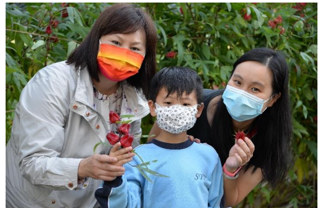
6 今年的洛神花大豐收的季節, 大家也滿載而歸呀!