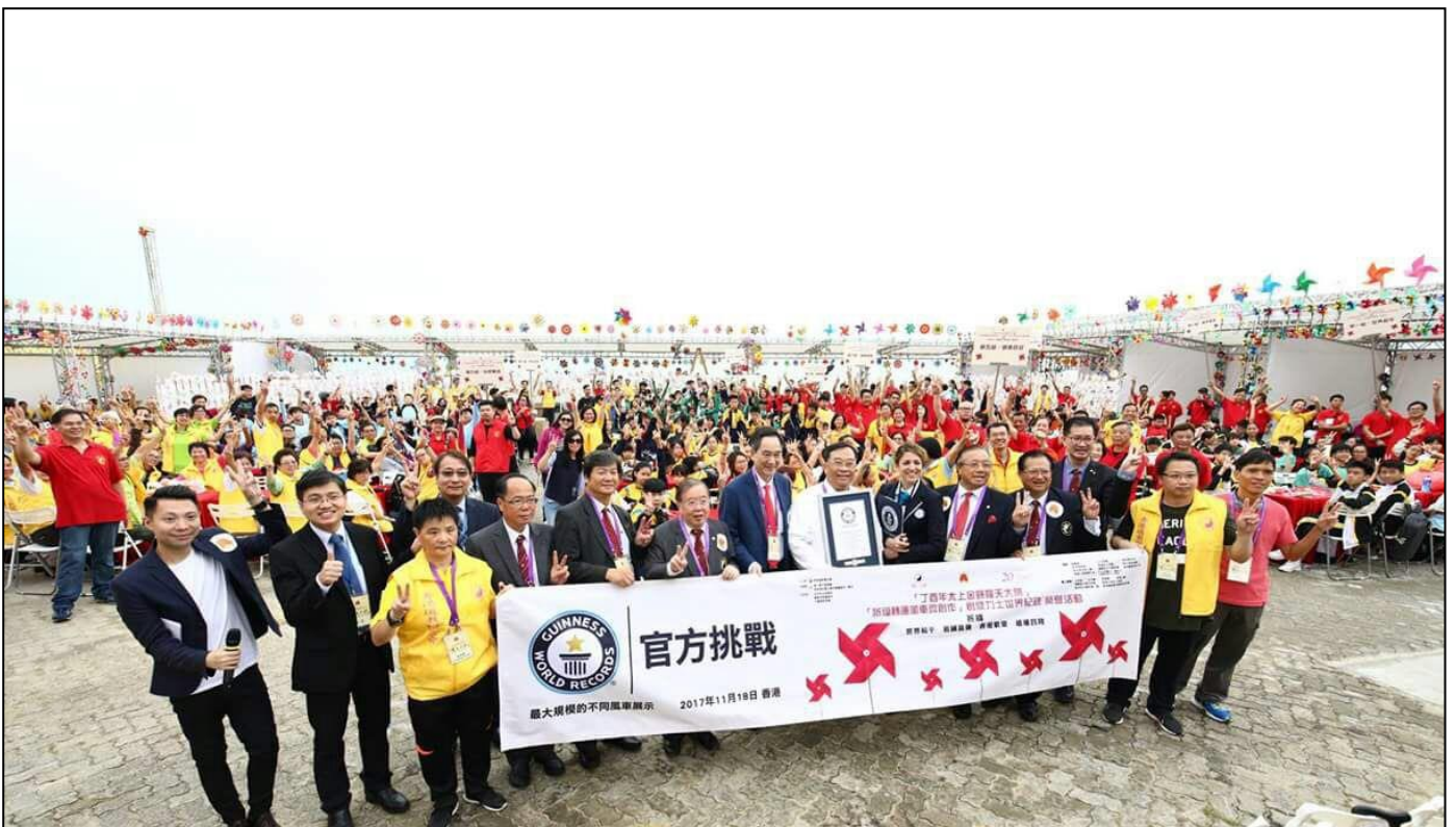
道聯會400多位中、小學生及義工們同心合力，摺出2000多個不同顏色、圖案的风車，成功創造摺風車健力士世界紀錄。