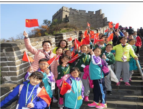
我們終於做到了「長城好漢」！