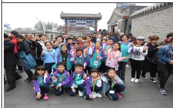
我們一起暢遊南鑼鼓巷，感受老北京氣息！