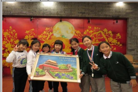
哇！好靚啊！深外附小，我們很喜歡你們畫的油畫！