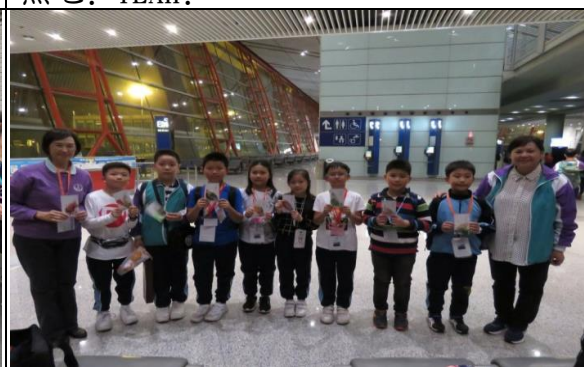
梁校長表揚在交流團用心學習的學生，在機場進行簡單而隆重的頒獎禮！