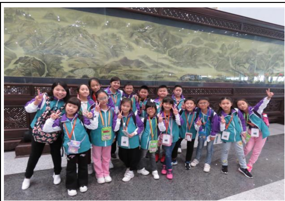
我們到達北京首都機場了！YEAH！