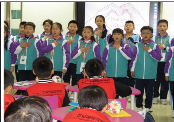
我們也用心演唱了 “We Are One” ! I love you, friends!