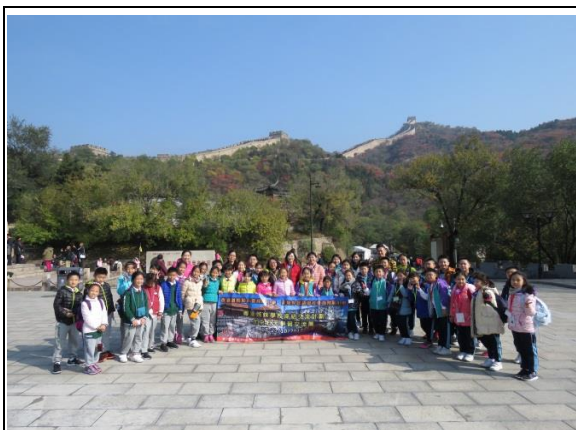
兩校在攀越長城前來一張大合照，留下美好回憶！