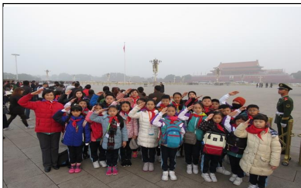
在天安門觀看升旗禮心情特別激動！