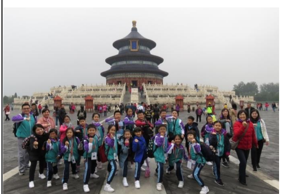
看我們在天壇前多威武！