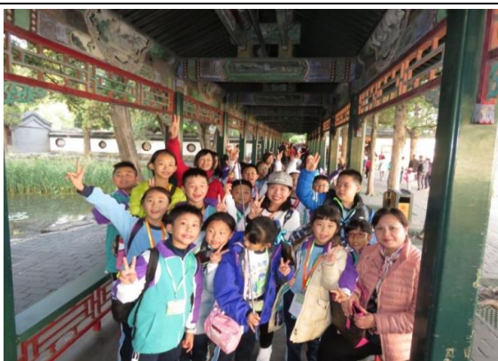
遊走頤和園長廊，十分開心！