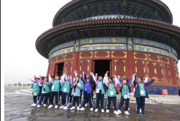
齊來在天壇高唱《弟子規》！