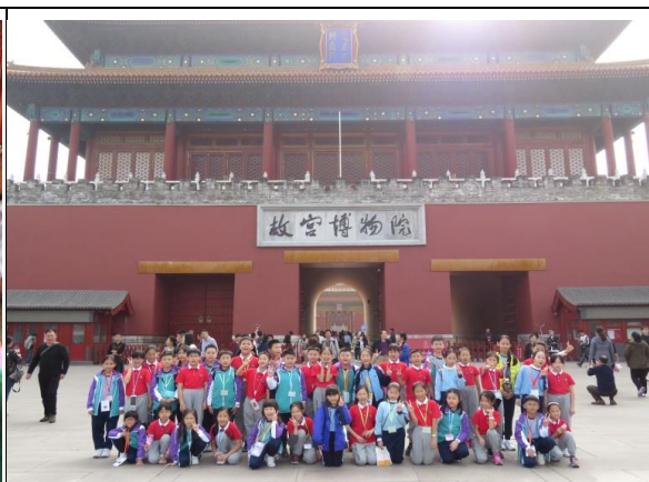
我們和深外附小的同學一起留下美好的回憶！