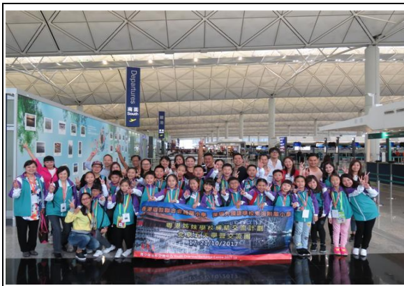
我們從香港機場出發往北京了！