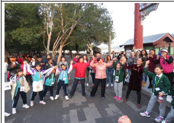
余博士、梁校長與兩校同學載歌載舞，歡聚快樂時光！