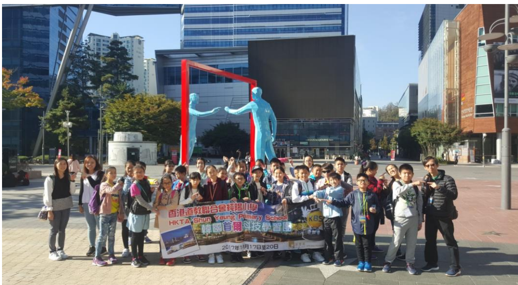
老師、同學在韓劇熱門拍攝場地前拍照留念。