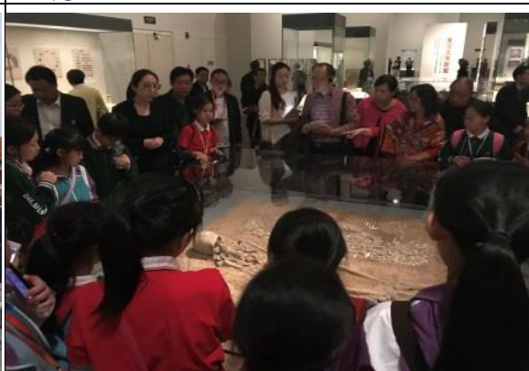
國家博物館內的展品令我們大開眼界！