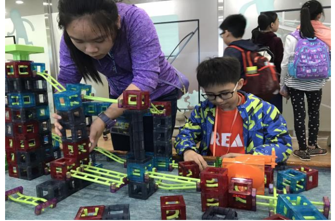
透過親手觸摸模型及從遊戲中，啟發同學的創造力。