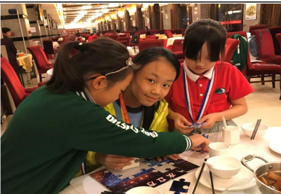
晚宴上，兩校學生一起玩北京名勝拼圖，多開心啊！