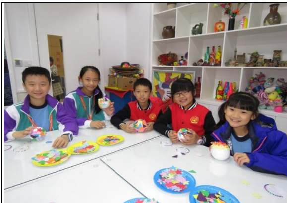
我們與新朋友及老師上視藝課，製作了「繽紛彩球」！