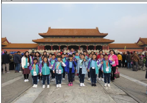
我們走進了故宮，親歷昔日的皇室氣派！