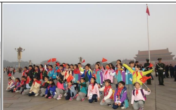
趁這難得的機會，在天安門前來個大合照吧！YEAH！