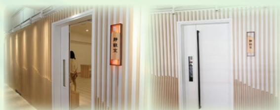
靜觀室位於學校地下 G09、G10。