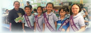
English Ambassadors are helping students with the game instructions.