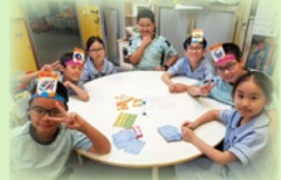
遊戲大使正進行訓練