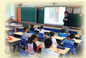
故事叔叔也來說故事