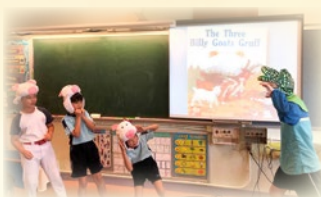
In this P.4 English enhancement class, students are performing the story 'The Three Billy Goats Gruff'.