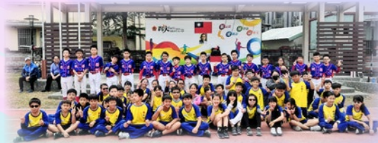
純陽棒球隊與嘉義市育人國民小學進行交流

「純陽棒球隊」於19/20年度再次衝出香港！於2019年12月19-24日到台灣嘉義參與第二十二屆諸羅山盃國際軟式少年棒球邀請賽，與其餘二百多隊台灣及國外小學棒球隊伍一同交流，最終本校棒球隊於小組賽中取得一勝一負，值得鼓舞！