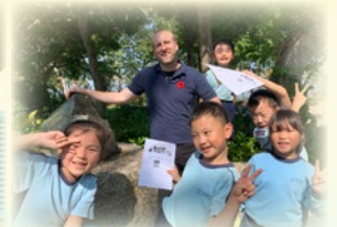
Wow! It's Mining History Display Area. It reminds us Ma On Shan has the biggest iron mine in Hong Kong! Amazing!