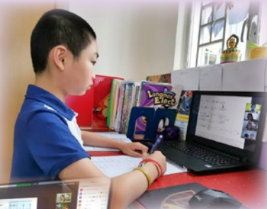
學生在家中參與實時教學 zoom 課堂，學習態度認真！