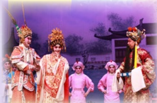
學生欣賞折子戲表演

本校參與香港八和會館於2019年10月11日(星期五)舉行的「粵劇藝術及品德情意教育工作坊」。工作坊內容包括：粵劇基本知識講解及示範、同學台上試演粵劇、粵曲齊唱、欣賞面譜化妝及折子戲，讓同學們對粵劇藝術有另一番體驗，從實踐中學習並欣賞音樂世界。