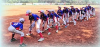
整齊隊形，團結一心，爭取佳績