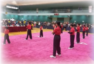
同學在比賽中紮馬揮掌， 功架十足

本校武術隊參加了《沙田武術錦標賽 2020》，並於小學組紫荊操及小學組集體器械勇奪冠軍佳績！