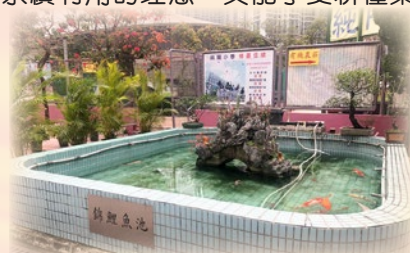
改裝本校的錦鯉魚池，成為魚菜共生系統供學生學習。