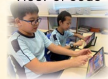
同學透過遊戲方式，學習編程技巧