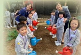
康傑中英文幼稚園何校長也一起陪伴同學澆水