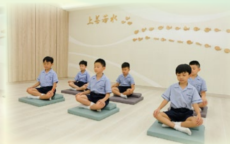
靜觀室內簡樸、寧靜，同學能專心進行靜觀練習。