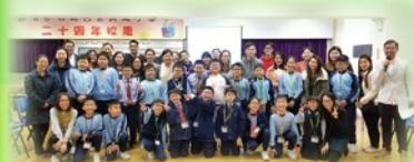
小四成長的天空迎新啟動禮，老師、家長與同學大合照