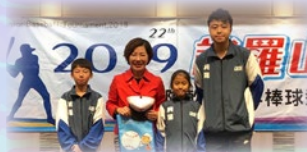
陳朗恩主任及兩位球員，在選手之夜與嘉義市市長黃敏惠合照。