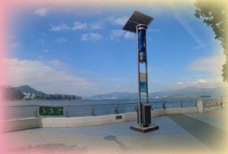
25 周年銀禧校慶攝影比賽高級組 (冠軍：5E 董巧晴 環保馬鞍山)