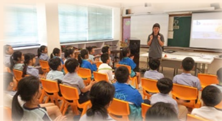
四年級學生上靜觀 Paws b 課程。