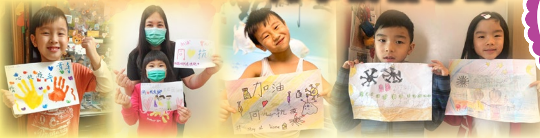
1A 馬光政同學 1B 黃藹琳同學 1B 李淵同學 1C 謝皓匡、1D 謝沛珈同學

4B 李采司同學 在這段疫情期間，我深深體會到醫生和護士的無私奉獻，希望大家一起留在家中防疫，減輕醫護人員的工作！大家加油！