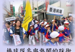
棒球隊參與熱鬧的踩街巡遊活動