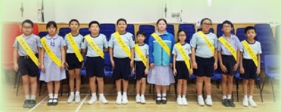
本年度的遊戲大使隊長