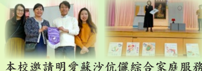
本校邀請明愛蘇沙伉儷綜合家庭服務中心，舉辦互動劇場「發現生活中的感動」，培養學生感恩惜福的價值觀，及提升學生對寬恕的認識及意願