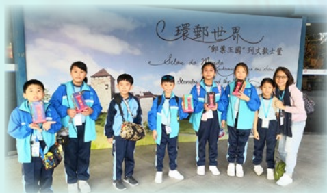
我們在通訊博物館買了很多精美的郵政產品回家！