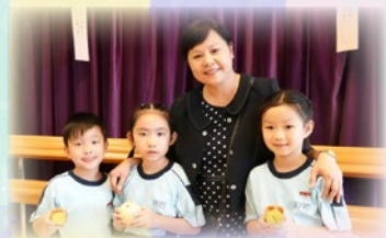
校長與我們一起猜燈謎，真開心！

為了讓學生能增加對中秋節傳統習俗的興趣，本校於九月十二日中文課堂期間帶領一至六年級同學進行猜燈謎活動，當天學生表現投入和積極，校園充滿濃濃的節日氣氛。