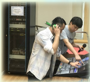
禮堂音響設備及舞台燈光系統數碼化

「禮堂音響設備及舞台燈光系統」數碼化，以配合學生各種日常表演需要，培養學生兩文三語的運用，訓練學生說話技巧及肢體表達的能力。