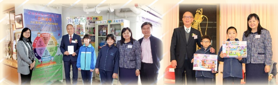
校監、校董贊助「正向加油站獎勵計劃」獎品