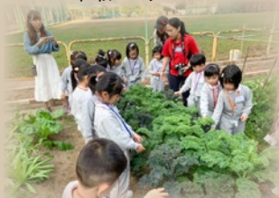
同學們對農莊內的〈雨衣甘藍〉很感興趣