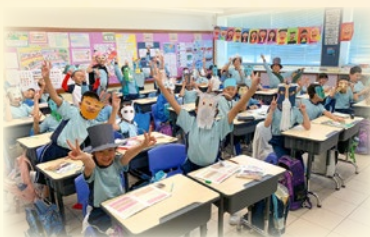
Students feel fun and motivated to learn English through mini dramas.