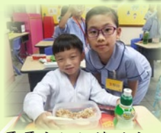
大哥哥大姐姐協助小一學生進行午膳及檢查其手冊