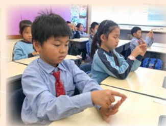
學生在進行手指呼吸練習。