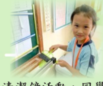
清潔鐘活動，同學正在清理粉筆槽上的粉末