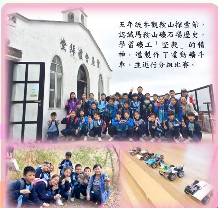
五年級參觀鞍山探索館，認識馬鞍山礦石場歷史，學習礦工「堅毅」的精神，還製作了電動礦斗車，並進行分組比賽。