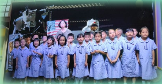
透過校園電視台活動，老師和同學們都可以在太空拍攝了!