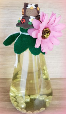
25 周年銀禧校慶 DIY 心靈瓶 親子設計比賽 (冠軍：5B 鄧浩言)