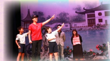
學生於台上參與有趣的互動環節