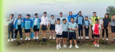
小六成長的天空活動，同學於烏溪沙石灘進行清潔服務