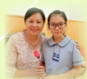
敬師日活動，同學為梁校長送上玫瑰花筆，以表敬意；而老師也在台上接受同學獻唱良師頌及玫瑰花