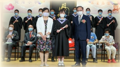
葉校監為同學授憑