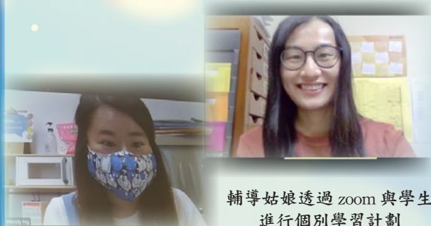
輔導姑娘透過 zoom 與學生進行個別學習計劃