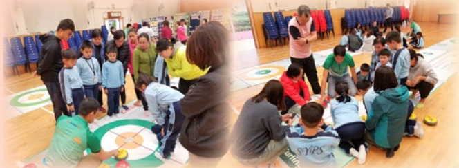
分組學習技巧、賽制，討論攻略，加強親子溝通。

本會於2020年1月13日至16日與香港地壺球協會合辦親子地壺球班，目的為了促進親子的合作和互動。