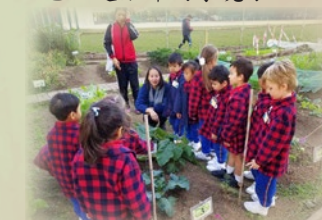
太陽島英文幼稚園(西貢分校)同學到參觀農莊的植物