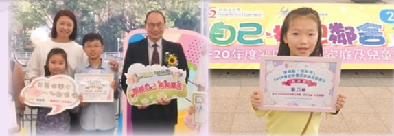
沙田區「綠絲帶」傑出家庭義工獎及傑出兒童義工獎