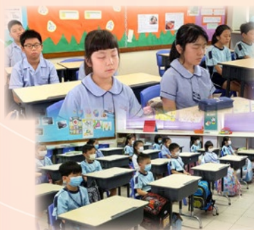
每天早上，全校學生進行靜觀呼吸練習。