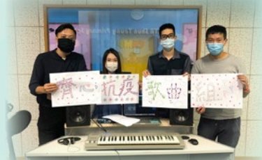
老師們合力創作抗疫歌曲

我們堅信陽光總在風雨後，無論順境抑或逆境，堅守信念才能勇往直前。願香港以至全世界及早走出疫情陰霾，重拾往日的歡樂。