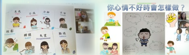
輔導姑娘讓學生覺察情緒，教導學生情緒舒緩的方法