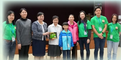
感激孫修女及老師們的熱誠款待，促進港澳兩地學生的交流！