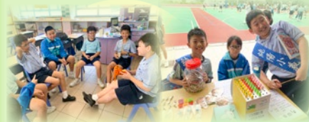
純陽小義工定期進行訓練，更協同學換領正向品格加油站獎勵計劃的禮物