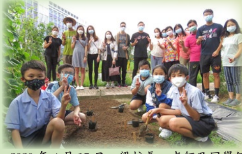
2020年4月15日，梁校長、老師及同學們一起參與太空南瓜及太空向日葵種子播種活動，期盼種出超大南瓜及太空向日葵。