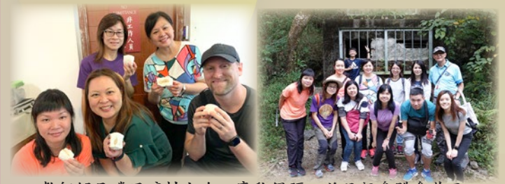
教師們品嚐了礦村小吃——腐乳饅頭，並且親身體會昔日礦工生活，尋找鐵礦石。