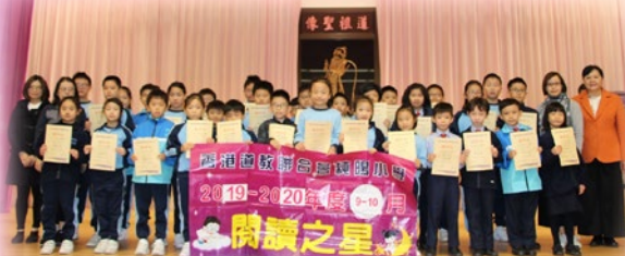
恭賀各班同學獲得閱讀之星的獎項

本校一向致力推行全校閱讀，目的是培養學生的閱讀興趣和提升學生的閱讀能力。希望能透過 < 閱讀之星 > 獎勵計劃，鼓勵及感染全校同學開展自己的閱讀歷程，感受到閱讀帶來的快樂。