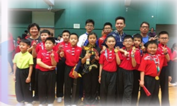
武術隊榮獲兩項 團體比賽冠軍