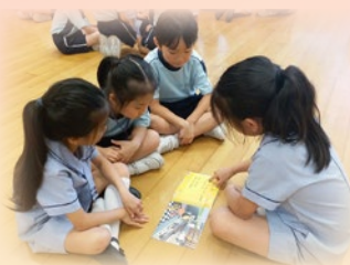
P.2 students are acting as reading buddies to P.1 students.