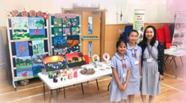
宣傳學校的藝術課程