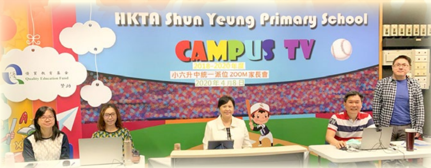
梁校長帶領同事們為 ZOOM 升中家長會作好準備