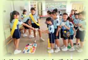
遊戲大使於小息帶領同學玩遊戲，同學樂在其中