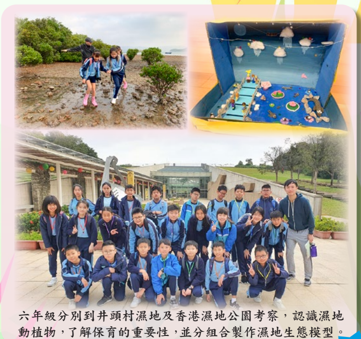
六年級分別到井頭村濕地及香港濕地公園考察，認識濕地動植物，了解保育的重要性，並分組合製作濕地生態模型。