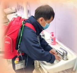
同學回校後要先清潔雙手