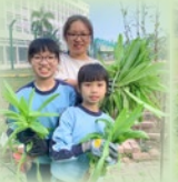
油麥菜大豐收，跟爸爸媽媽小妹妹臉上充滿了笑容。一起拔蘿蔔，很開心呀！

本校有機農莊成立多年，透過親子耕種活動，同學和家長都能親身體驗農耕的樂趣，並對生態環境有更進一步的認識。此外，亦能促進親子關係，可謂一舉兩得。