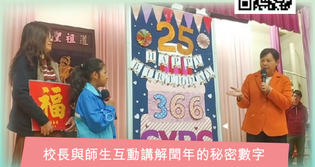
校長與師生互動講解閏年的秘密數字

校園電視台攝製團隊負責記錄校園各項大型活動，並透過網絡，讓家長和師生們可以隨時隨地在家中重溫精彩片段。