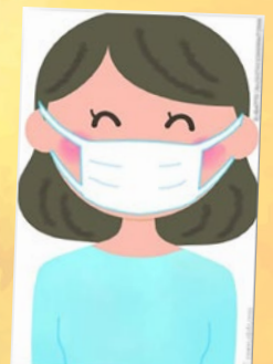
學校在地下大堂，走廊、各課室及各洗手間張貼正確戴口罩、「咳嗽禮儀」、「關蓋沖廁」及「洗手七步曲」等教育宣傳告示