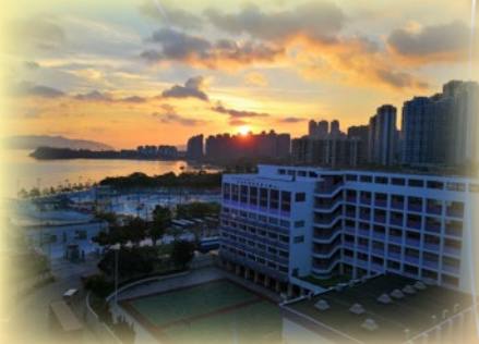
25 周年銀禧校慶攝影比賽初級組 (冠軍：3C 常皓月 馬鞍山的日出)