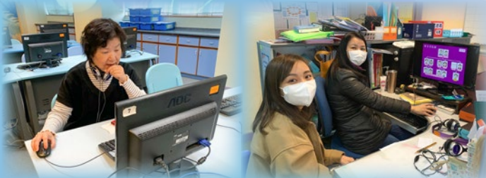
科任老師用心製作聲音導航教學短片供學生自學