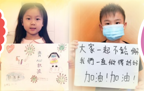
1C 吳晞嘉同學 1D 李浩然同學

1B 黃藹琳同學 留在家中遠離新冠，離家出外配帶口罩，時時刻刻清潔雙手，全民同心一起抗疫，藹琳與純陽全人共勉。