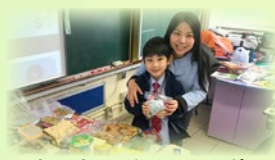
乾媽爹計劃，老師把佳節小禮物及祝福，送給同學，讓同學感受佳節歡樂及關懷