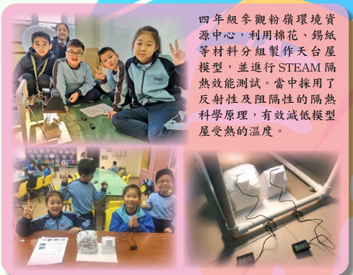
四年級參觀粉嶺環境資源中心，利用棉花、錫紙等材料分組製作天台屋模型，並進行 STEAM 隔熱效能測試。當中採用了反射性及阻隔性的隔熱科學原理，有效減低模型屋受熱的溫度。