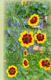
蛇目菊開花了，十分美麗。