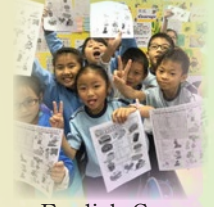
English Game - Word Search