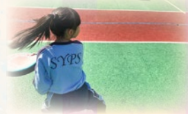
飛出躲避盤的標準動作