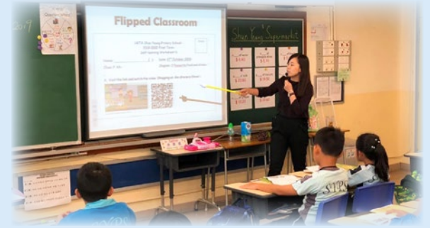
P.4 學生專心參與英文科閱讀課堂。