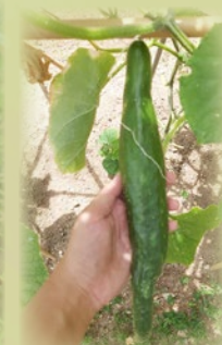
又肥又大的黃瓜終於長成了！