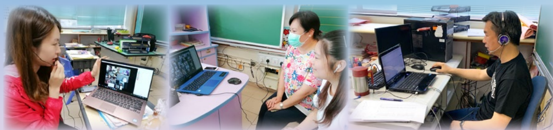
科任老師為同學們進行實時教學，聽到老師親切的聲音，同學們都表現得十分投入！