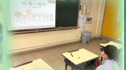
同學觀看短片《抗疫小夥伴》