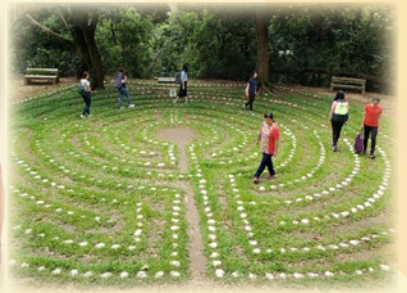
梁校長及教師們在「明陣」慢步行走，讓心靈沉澱。