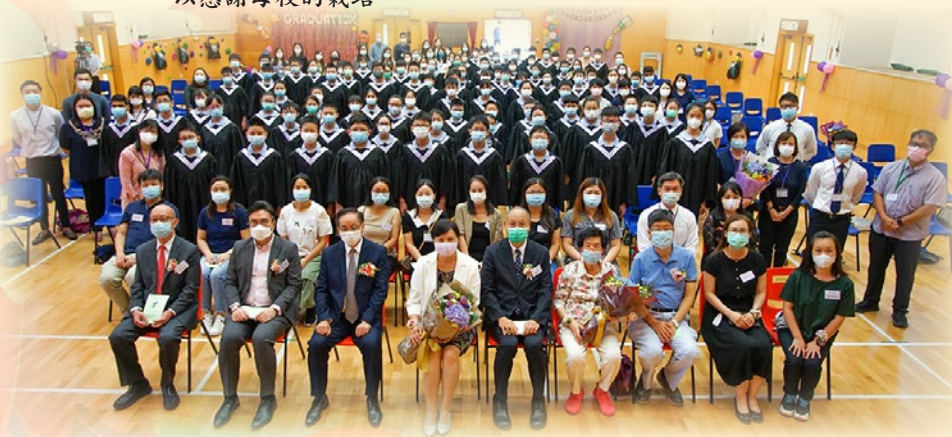
畢業生及嘉賓大合照