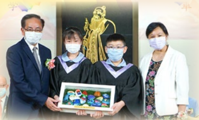
畢業生代表向母校致送紀念品，以感謝母校的栽培