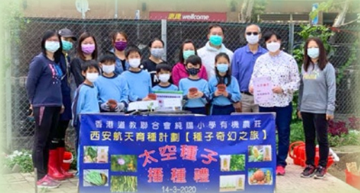
任校長、梁校長與各位來賓和同學合照，大家將會在未來一年見證著太空種子的成長！