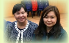
教育局江小姐到校參與「愈感恩、愈寬恕、愈快樂計劃」活動