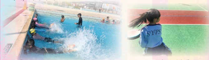
同學們正在進行自由式的訓練