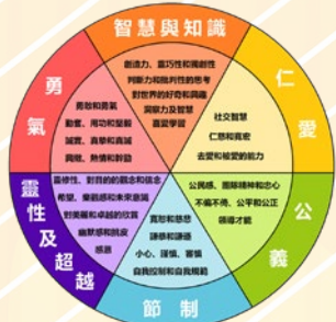
六種美德、二十四個品格強項

正向品格由美國正向心理學之父沙利文 (Martin Seligman) 提出。他將人性正向特質歸納成六種美德，包括：智慧與知識、勇氣、節制、靈性和超越、公義及仁愛。19-20 年度的正向教育主題為「勇氣 - 堅毅」，同時推行「堅毅之星」，培養學生的正向品格。