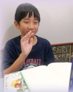
外籍英語老師正為同學們進行英語會話課課堂