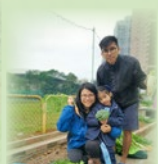
義務導師示範如何鬆土犁田看！豐收啊！