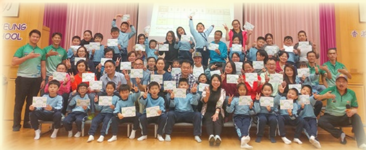
完成一連四天的親子培訓課程，大家都取得參加證書。