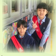
家長日風紀在課室外進行服務