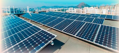
本校引入再生能源 - 太陽能光伏裝置，讓同學體驗現今的環保科技

本校申請優質教育基金重置魚池及魚菜共生系統，藉著結合水產養殖及水耕栽培，讓同學明白資源永續利用的理念，又能享受耕種樂趣，建立可持續發展的校園環境。