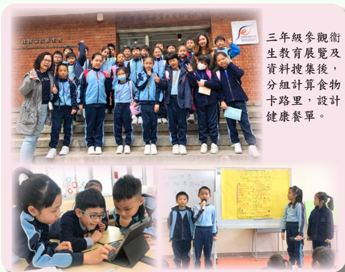
三年級參觀衛生教育展覽及資料搜集後，分組計算食物卡路里，設計健康餐單。