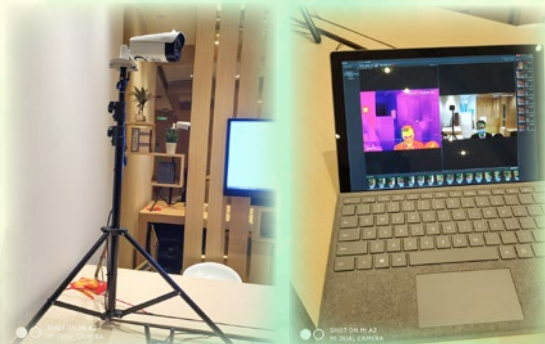
添置了紅外線熱成像探溫儀，能快速有效地探測進入校園人士有否發燒徵狀，減低病毒快速傳播，作全天候防護。