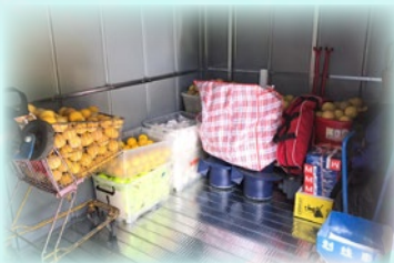
物品易於儲取，能令訓練更有效率。 球員能夠自行擺放訓練物品，培養良好習慣。

本校參與棒球及女子壘球運動的學生不斷增加，興趣班與校隊合共接近200人。有見及此，本校於純陽棒球場內增設了2個大型儲物櫃，以便學生提取訓練用具，並增加訓練之效率。