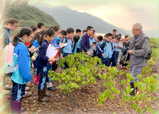
六年級同學由教授帶領到馬鞍山井頭村考察濕地，讓同學親身觸摸濕地的動植物。