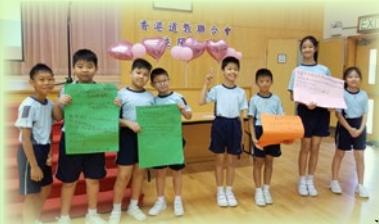
風紀進行團隊訓練活動