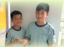
好人好事計劃，同學把拾到的金錢交還給失主，值得嘉許