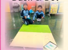
同學利用編程控制 Dash 繪畫不同圖案