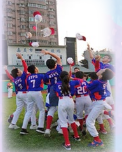
純陽棒球隊於分組賽取得一勝佳績，球員們都十分興奮。