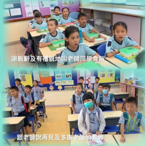
謝飯辭及有禮貌地叫老師同學食飯