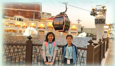
我們乘坐纜車觀賞了澳門的夜景，令人陶醉！