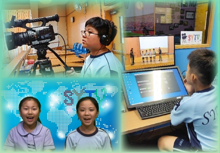
我們的校園電視拍攝小隊，在各個拍攝及後台製作崗位，都能獨當一面，應付自如。