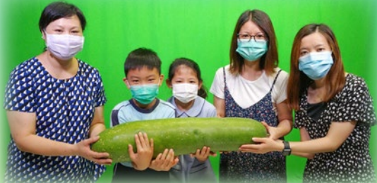
本校將有機農莊收成的大冬瓜，進行數學科估量活動。透過先估計，後量度冬瓜的重量和長度，學習生活中的數學。