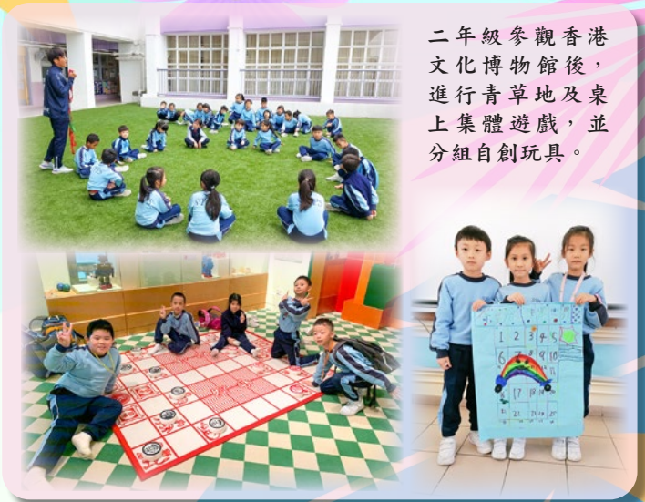
二年級參觀香港文化博物館後，進行青草地及桌上集體遊戲，並分組自創玩具。