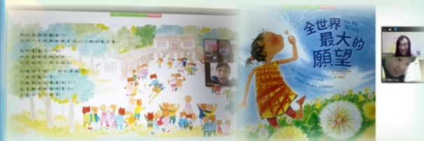
輔導姑娘與學生共讀主題繪本