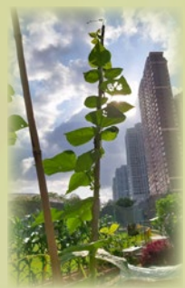
太空架豆已有245厘米高，到達了棚架的頂點！