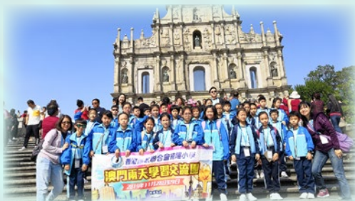
在著名的大三巴牌坊前留影！