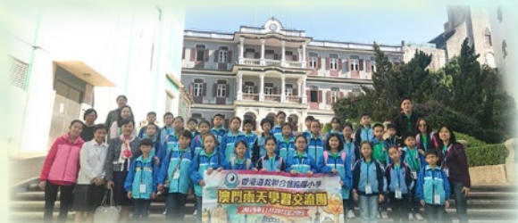
可以參觀當地學校聖羅撒女子中學中文部（小學部），更可以進行觀課活動，令我們獲益良多！

第二天：聖羅撒女子中學中文部（小學部） → 澳門觀光塔 → 港珠澳大橋 → 回港