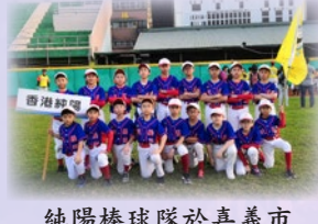
純陽棒球隊於嘉義市立棒球場合照