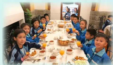
享用葡式的晚餐，令我們大快朵頤！

第二天：聖羅撒女子中學中文部（小學部） → 澳門觀光塔 → 港珠澳大橋 → 回港