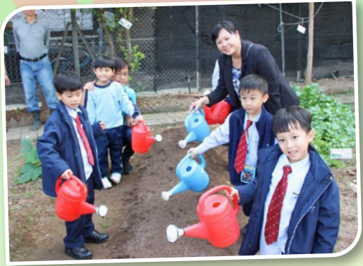
我們小心翼翼地澆水，希望植物快高長大！

今年1月7日至9日，學校為一年級同學舉行跨科小農夫活動，透過農莊義工姨姨的介紹，學生不但能欣賞到有機農莊內不同的植物，更能學習翻土、播種、澆水，作一個真實的小農夫。此外，學生更可品嚐從田裏拔出來的蘿蔔，大家都稱讚蘿蔔又香又甜呢！