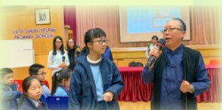
通善壇葉崇意道長到校為學生進行道化教育，同學投入參與