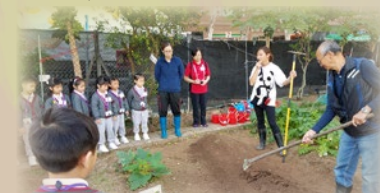
農莊義工向同學示範正確鬆土方法