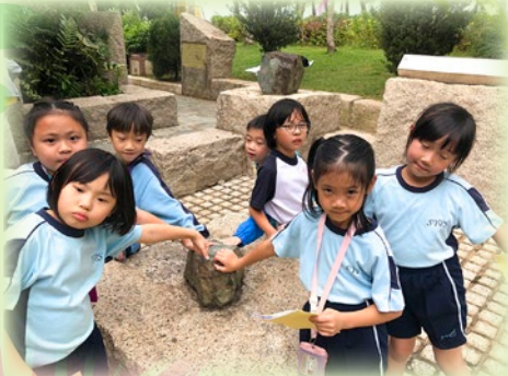
學生到馬鞍山公園認識了馬鞍山四周是含豐富的礦石，同學們更嘗試以磁石吸住礦石呢！

本年度全方位跨學科學習課程的主題為「探索鞍山·建構生命」，從多元學習的歷程中，培養學生堅毅的精神。