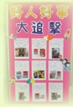
好人好事大追擊，展示了同學樂於助人及路不拾遺的好行為