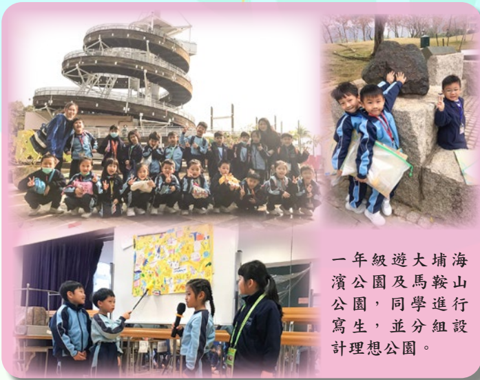
一年級遊大埔海濱公園及馬鞍山公園，同學進行寫生，並分組設計理想公園。

為了讓一至六年級學生透過親身經歷以獲取不同的學習經驗，常識科在 2020 年 1 月 13 至 17 日於各年級舉行「專題研習周」，目的是透過戶外考察及資料搜集，發展學生「自主學習」的能力，讓他們能學會學習。同學完成考察任務後會向同學匯報，並進行全民投票，選出最喜愛的作品。