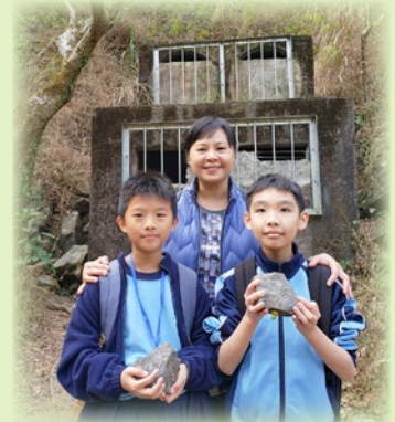
同學參觀礦洞，從中學習礦工堅毅的精神，立志將來長大後回饋社會。