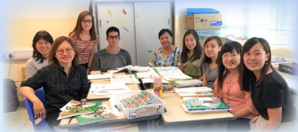
教育局語文教學支援組發展主任、梁校長及 P.4 英文科任共同備課。

本校英文科教師參加了教育局〈語文教學支援計劃〉，由教育局語文教學支援組發展主任帶領 P.4 英文科任進行備課及觀課活動，優化英文科課程及提升學生閱讀能力。