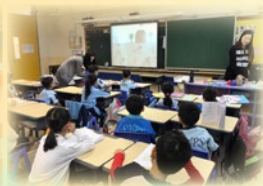
故事姨姨說故事， 同學十分投入