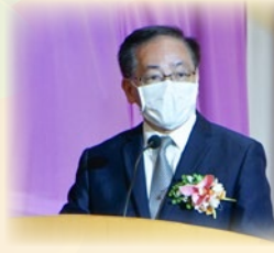
葉校監致辭，勉勵同學要以不屈不撓的精神去面對困難