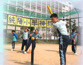
老師會利用本校棒球場進行體育課，令學生掌握打棒球的技巧。