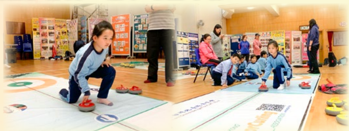
同學都全神貫注，全情投入，認真學習和比賽。