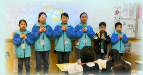
學生分成小組上課，課堂完結時更為各班的同學獻唱「Hello to All the Children of the World」！