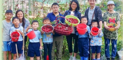
一起採摘洛神花，大家都很雀躍！