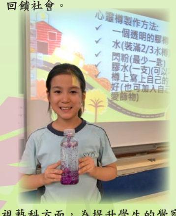
視藝科方面，為提升學生的覺察能力、加強專注力，指導學生製作獨一無二的「靜觀心靈瓶」。