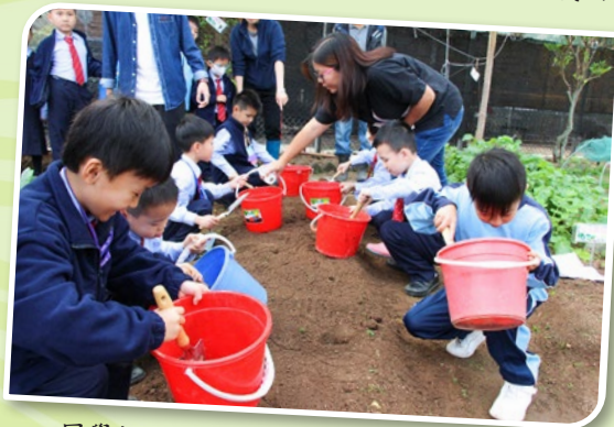
同學們正在認真地學習翻土及播種。