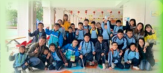
小四成長的天空挑戰日營