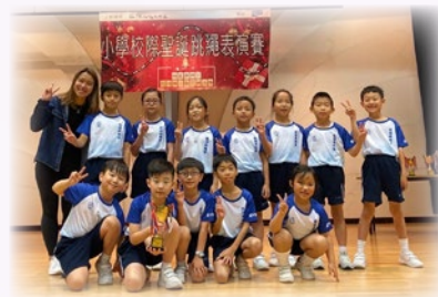
同學們認真努力訓練，取得佳績！

本年度成立之花式跳繩隊於 12 月參加《小學校際聖誕跳繩表演賽 2019》，在多間學校中脫穎而出，取得小學組季軍！