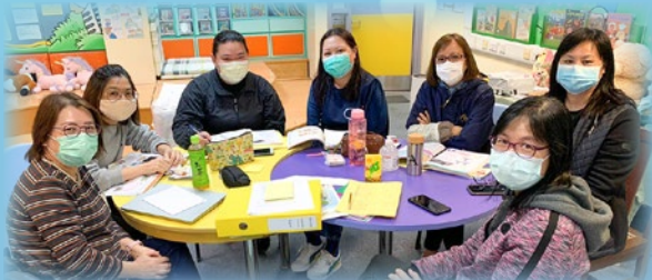
各級科任老師進行備課會及商討網上自學內容

因新冠肺炎疫情的關係，農曆新年後一直停課，但無阻本校學生努力學習的志向。在停課期間，老師們用心製作聲音導航教學短片，供學生自學。生動活潑、趣味十足的短片有效地提升了學生學習動機。在復活節假期後，老師更為學生進行實時教學，學生們透過視像課堂，跟老師和同學進行互動學習，令同學即使在疫情期間也能鞏固學習的基礎。