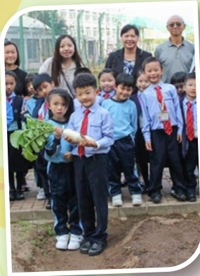
看！我們拔的蘿蔔多肥美！