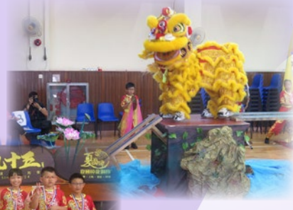
醒獅隊取得 小學傳統獅組冠軍

本校醒獅隊參加了由夏國璋龍獅發展基金舉辦之《香港學界龍獅比賽 2019 回歸盃》比賽，取得小學傳統獅組冠軍。