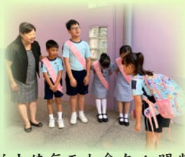
禮貌大使每天也會在 A 開當值，與師生及家長打招呼