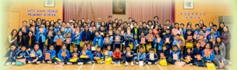
2020年1月4日親子賣旗活動，為自閉症人士促進福利會賣旗，約有53個家庭參與，同學表現投入