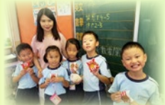
感謝聖公會捐出月餅與花燈予本校，讓全校師生於佳節一同品嚐月餅，同學也學懂感恩