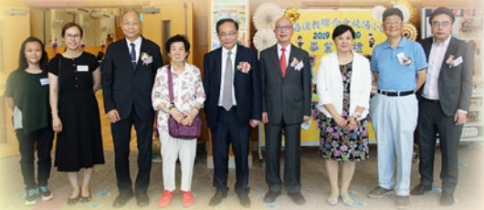
典禮前嘉賓於禮堂前留影