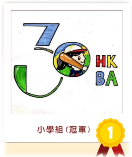
恭賀 4D 林凱晴取得 香港棒球總會 30 週年 標誌設計比賽小學組冠軍