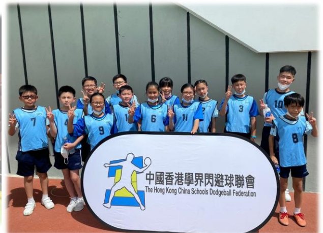
恭賀閃避球隊勇奪全港青年閃避球回歸盃慈善錦標賽小學組季軍