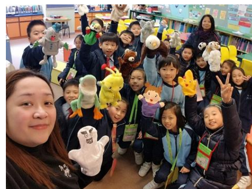
同學利用小布偶進行故事演繹。