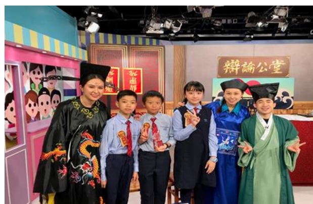
同學參與 Viu TV《辯論公堂》小學辯論比賽，獲得演繹風格獎。