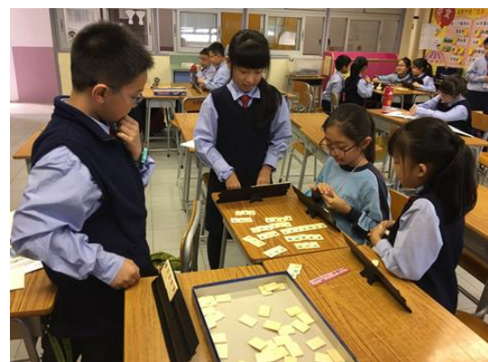
同學們玩 Rummikub 數學棋，互相切磋。