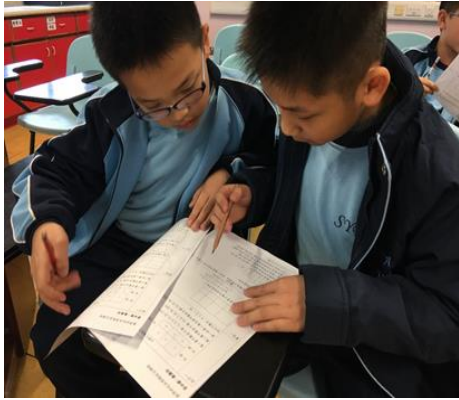
同學們進行討論，解決數學疑難。