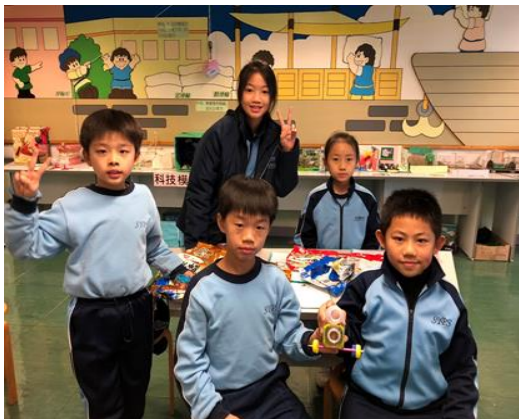
同學合力製作環保動力車。