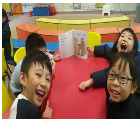
二年級同學與一年級同學伴讀。