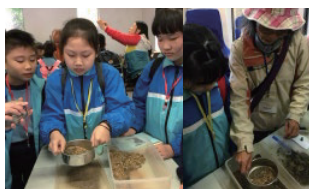
學生認識昔日開採鐵礦的方式