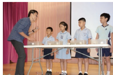
學生參與礦工體驗活動