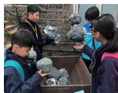
學生認識昔日礦工的艱苦工作