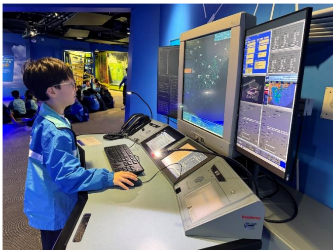
模擬航空交通管制及通訊