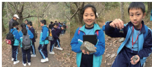
學生在昔日的鐵礦場附近尋找磁鐵礦