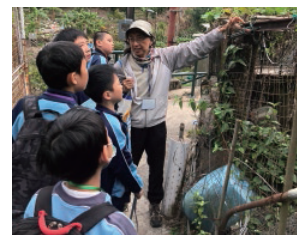
學生透過走訪礦村，了解昔日礦村的面貌和礦工的生活環境